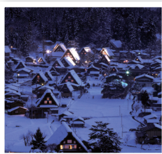
●合掌村 白川村