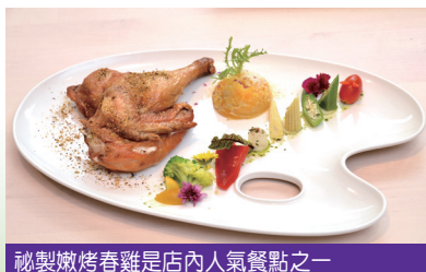
祕製嫩烤春雞是店內人氣餐點之一