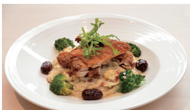
麻油雞嫩飯佐烤雞腿排色香味俱全