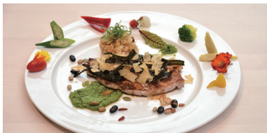
店內新菜色 - 丹麥進口豬里肌帶皮豬排佐海苔腐皮酥