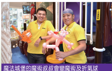
魔法城堡的魔術叔叔會變魔術及折氣球