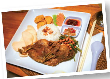
▲稻田鱗鴨餐／製作過程繁瑣，用十幾種香料磨成的粉調和，抹在小鴨身上，下鍋煮到入味後，再油炸五分鐘，將皮、骨等炸到酥脆，製程費時六小時。

到峇里島旅遊，若時間充裕，還可以搭船到峇里島祕境——藍夢島玩水上設施，此處的海景比峇里島更美，建議可以住在島