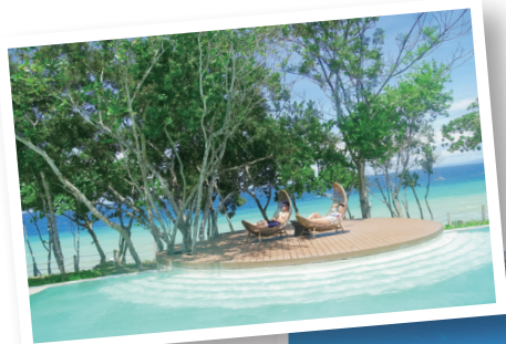
▲薄荷島高質感度假村 AMORITA RESORT。

更是成熟，兩地的高級度假村都非常多，交通極為方便，餐飲以美式料理、印尼特色料理等異國料理為主，料好味美，五天四夜就可以玩得盡興，是適合所有族群的海島行程。