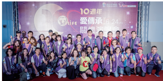
▲ 最有愛心的永達志工熱情接待貴賓。