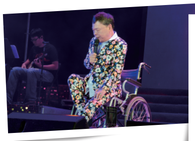
▲ 演唱會在實力派歌手阿吉仔的歌聲中畫下完美句點。

、王彩樺、張瓊姿、向娃、陳美鳳分別帶來「金嘛無尤」、「保庇」等精彩曲目；緊接著實力派唱將也是金曲歌王洪榮宏以師兄之姿，帶領著師妹林為音深情對唱，讓現場觀眾大呼意猶未盡；許久不見的林淑容以一曲「昨夜星辰」勾起觀眾無限回憶，壓軸演出則是以「小巨人」阿吉仔招牌曲「命運的吉他」為演唱會劃下完美句點。