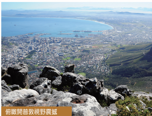
俯瞰開普敦視野震撼

博斯德海岸 極少人知道企鵝不一定是只住在冰天雪地的南極，在南非也可以看到企鵝。博斯德海岸位於西蒙鎮，距離開普敦僅需四十分鐘車程。企鵝一年四季都在這裡活動，由於企鵝的活動範圍是半開放式的，如果幸