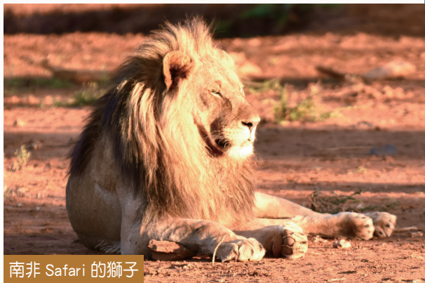
南非 Safari 的獅子

程。搭乘飛機打掉二天，主行程為三天 Safari，加上三至四天的城市酒莊或是海濱城市探訪，是非常完美的安排。