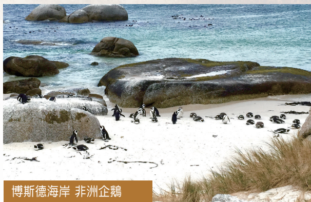
博斯德海岸 非洲企鵝