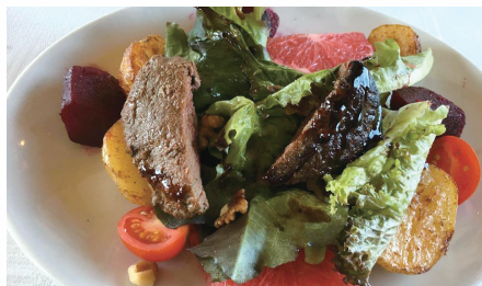
駝鳥肉口感像瘦牛排，健康又低脂。

南非擁有世界級的美食，主要的原因之一為此地陽光日照充足，極少環境污染，所以食材的質量相當高。南非前十大餐廳幾乎都在酒莊區，熱愛佳釀美酒的旅客不能錯過。