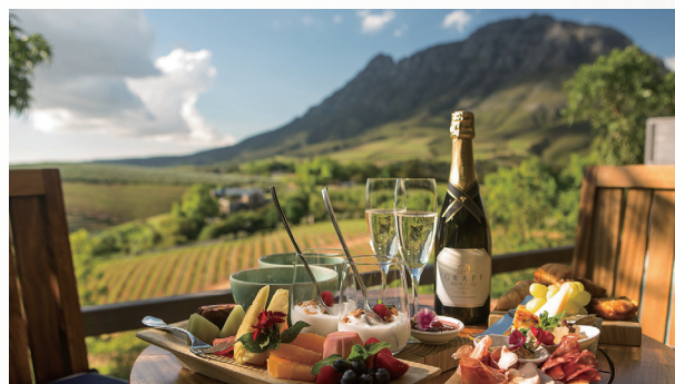
集合藝術、美食、美酒與時尚奢華品味的 Delaire Graff Estata 飯店