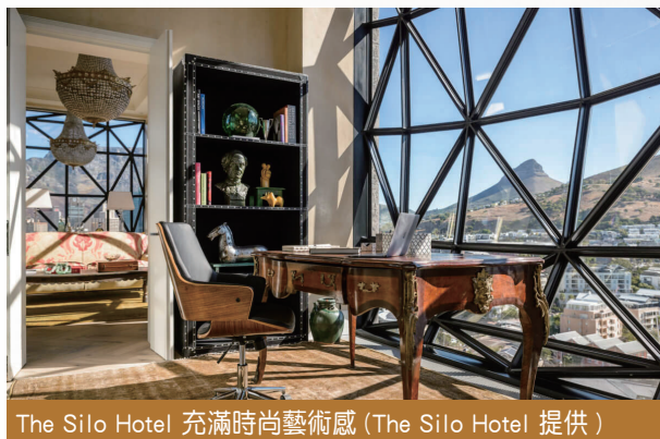
The Silo Hotel 充滿時尚藝術感