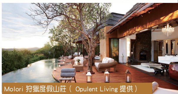
Molori 狩獵度假山莊

獵遊後，可以居住在 Molori Safari Lodge 狩獵度假山莊，僅有五間 Villa 套房，有如頂級私人招待秘所，而且