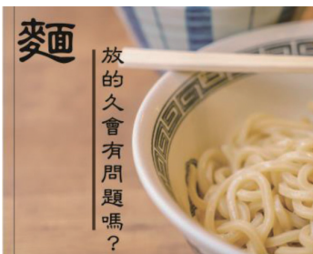
放的久會有問題嗎？

食藥署提醒，消費者應購買外觀、氣味正常的產品，選擇信用良好之商家，並優先選購從冷藏櫃取出販售之產品，購買後應儘速冷藏，不可長時間放置於室溫。麵製品宜有完整包裝，散裝產品應儘速食用，飲食安全才有保障。(本文引用自食品藥物管理署「藥物食品安全週報」第六一四期)