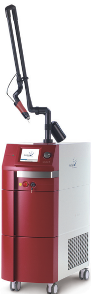
TattooStar R 紅寶石肌淨光雷射儀