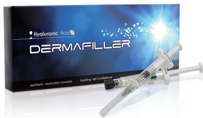
DermaFiller 玻尿酸皮下植入劑