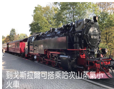
到戈斯拉爾可搭乘哈次山蒸氣小火車