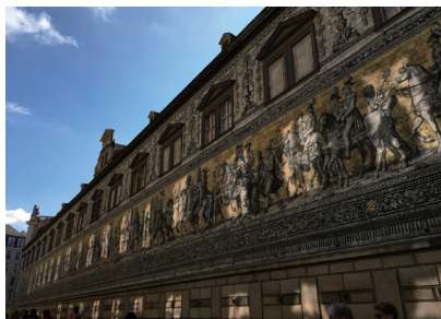
德勒斯登皇宮外牆以麥森磁磚25,000片製成的王侯馬列圖

畔的佛羅倫斯。整座城市在東德時期便於文化、軍事跟經濟上佔有舉足輕重的位置，卻也因此難逃二次大戰的轟炸，如今看到的一磚一瓦，都是之後重建而來。德勒斯登分為舊城跟新城區，大部分的景點都集中在舊城區，充滿古典文化藝術氣息，緩步其間，景色真是美不勝收。