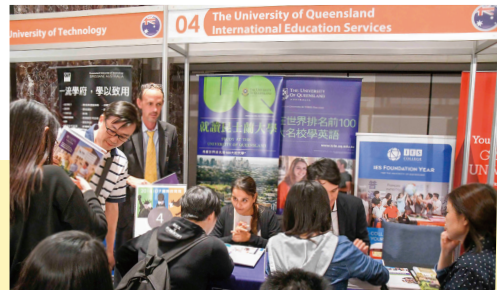
IDP 每年分別於一月、三月、七月、十月舉辦留遊學展覽。

績更是爆量成長。她指出，當公司制度化、一線主管合格，自然而然就會產生同樣的目標與方向，向心力凝聚，一切就會愈來愈好。