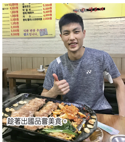
趁著出國品嘗美食。