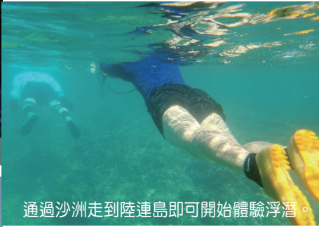
通過沙洲走到陸連島即可開始體驗浮潛。