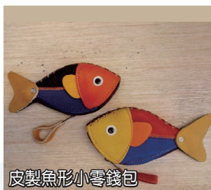
皮製魚形小零錢包