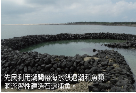
先民利用潮間帶海水漲退潮和魚類洄游習性建造石滬捕魚。