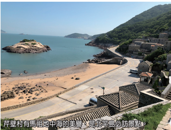
芹壁村有馬祖地中海的美譽，是北竿島必訪景點。