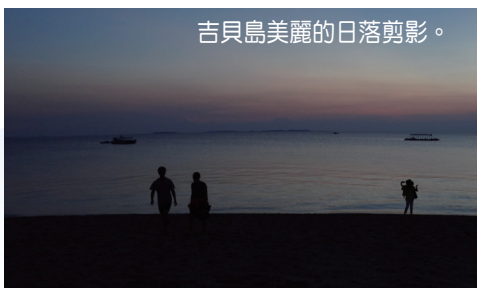
吉貝島美麗的日落剪影。

石滬：吉貝島是石滬的故鄉，早年大陸居民來到吉貝島捕魚，發現面對秋冬季的東北季風，漁船無法出海捕魚，於是利用當地潮間帶滿潮與乾潮間潮差可達四公尺以上，導致大魚可以游進來的環境特性，發明石滬，以玄武岩及珊瑚礁在吉貝