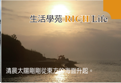
清晨太陽剛剛從東方的海面升起。

島四周打造一座座石滬，全盛時期石滬多達兩百多座，目前島上僅剩一百多座石滬，尚有八九座還可運作。也因為石滬的發明，島上的居民發展出一套公平分配石滬魚獲的模式。建議來到吉貝島，一定要先了解石滬，遊客中心旁邊有石滬館，可參加在地文史工作者舉辦的講座課程，也可參加套裝行程，除了聆聽講解，還能下海看看石滬長怎樣，體驗以石滬抓魚的樂趣。