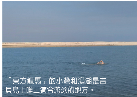
「東方龍馬」的小灣和瀉湖是吉貝島上唯二適合游泳的地方。