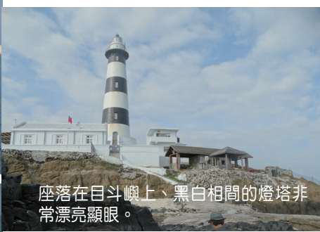
座落在目斗嶼上、黑白相間的燈塔非常漂亮顯眼。