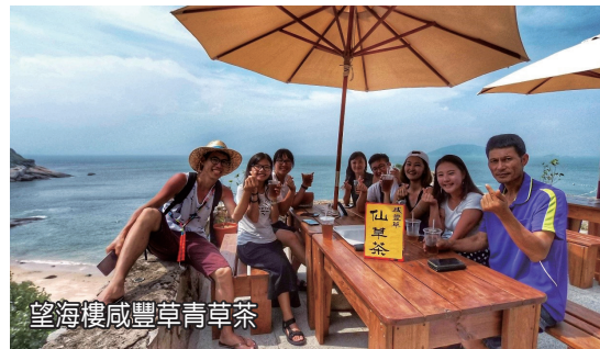
望海樓咸豐草青草茶

高粱等滋味都非常醇香，價位又超值。除此之外，馬祖淡菜及冷凍黃魚更是島主推薦必買，價廉又美味！