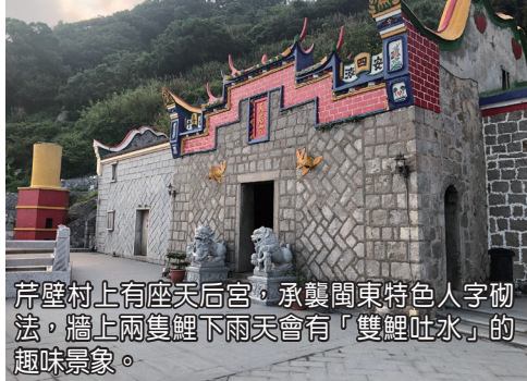
芹壁村上有座天后宮，承襲閩東特色人字砌法，牆上兩隻鯉下雨天會有「雙鯉吐水」的趣味景象。