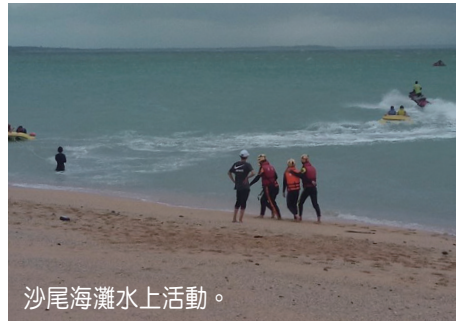
沙尾海灘水上活動。

麵，直接放上一整條臭肚魚，有時還會加附上一隻清蒸三點蟹，豪邁吃法讓人羨慕，午餐、晚餐就更豐盛了，海膽、石斑、河豚皮、沙蝦、野生石蚶、小龍蝦等，甚至還可能吃到鮫魷魚生魚片，體驗一把最無敵鮮甜的豐盛海味！