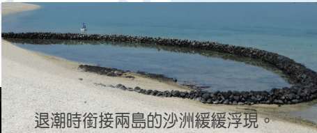
退潮時銜接兩島的沙洲緩緩浮現。