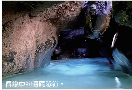
傳說中的海底隧道。

由於魚獲新鮮，吉貝的海鮮料理方式非常單純，就只單純以鹽嗆的方式料理，因為要吃到海鮮的鮮味與原味，不會有其他多餘的調味料。當地人三餐都吃魚，早餐一碗鮮魚