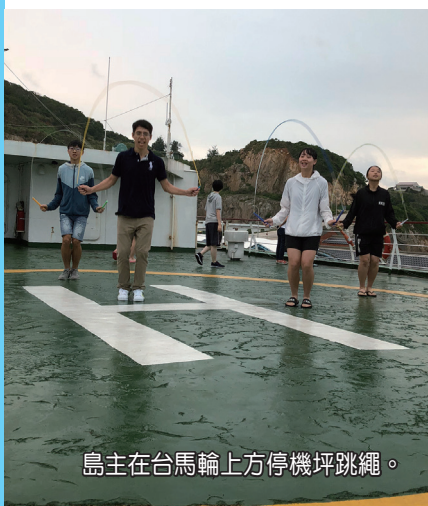
島主在台馬輪上方停機坪跳繩。

★島主便利貼：二月底前遊覽馬祖，馬管處提供每人最高一七〇〇元的補助喔！（詳情可撥打電話：〇八三六-三五六三一轉八六）