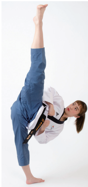
品勢主要展現跆拳道基本動作、美感及流暢度。

當時的心情，她表示，其實比完賽才知道自己是第一個奪牌的選手，賽後手機訊息有數千筆未讀，臉書好友瞬間超過上限，後來甚至在路上也會被認出，要求合照。剛開始的確有點不習慣，但經過沉澱後，覺得能讓國人更認識品勢，支持這項運動，是一件很好的事。