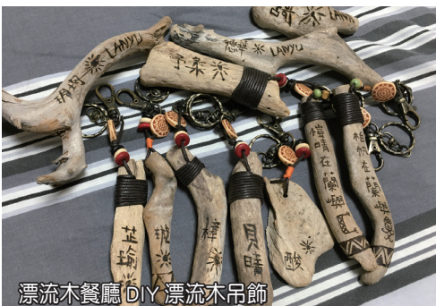
漂流木餐廳DIY漂流木吊飾

來到蘭嶼，必買的伴手禮除了飛魚乾及明信片之外，島主建議可以在漂流木餐廳自己DIY別具巧思的漂流木吊飾，可以先向餐廳訂作，之後請老闆娘幫忙製作，或者請老闆娘指導自己DIY，這些漂流木都是從蘭嶼海邊撿回來的，裝飾