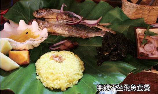
無餓不坐飛魚套餐