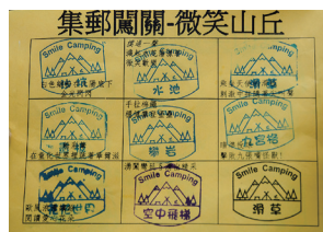
微笑山丘設計「集郵闖關」九宮格表，增加小孩體驗活動設施的成就感。

宛如孩子們露營天堂的微笑山丘，活動設施多到可以設計「集郵闖關」九宮格表，讓小孩藉由體驗活動蒐集每個設施的印章戳印，提高參與的動力與成就感。今年九月下旬更將原本的B區營地改為大型的水樂園，寧願降低營地數量，也要增加孩子們的玩樂設施，一句「因為我喜歡小孩」表露