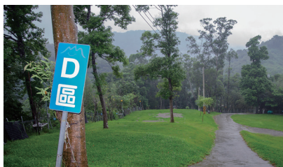
微笑山丘 D、E 區為草皮營地，營地以階梯式區隔開來。