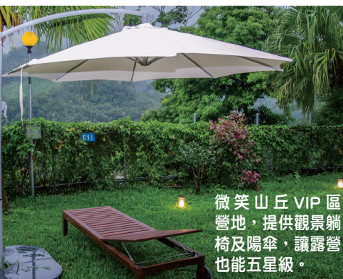
微笑山丘VIP區營地，提供觀景躺椅及陽傘，讓露營也能五星級。

會提供免費冰品，讓營客吃冰消暑一下；逢寒冷冬日，則會免費供應熱薑母茶；逢特殊節目，更會提供供應食物或安排應景活動，例如冬至供應湯圓，跨年在營區施放煙火等等，微笑山丘的周到體貼，給予營客「家」的溫馨感受。