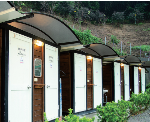
微笑山丘打造五星級木製盥洗設備、廁所。