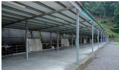
微笑山丘 A、C 區為有雨遮的營地，更附活動式簾幕，西曬時可下拉遮陽。