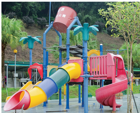
新設立的水樂園設施多元，包含大水桶滑梯組、瀑布、趣味倒水桶、迴轉水柱、水雨傘、噴水龍、大小噴水槍等，絕對讓小孩們玩到HIGH。

會提供免費冰品，讓營客吃冰消暑一下；逢寒冷冬日，則會免費供應熱薑母茶；逢特殊節目，更會提供供應食物或安排應景活動，例如冬至供應湯圓，跨年在營區施放煙火等等，微笑山丘的周到體貼，給予營客「家」的溫馨感受。